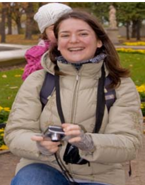
(ワルシャワの春休み)

ポーランドで、日本文化と茶道をぜひ紹介したいと思って、講演からお稽古まで、いろいろな活動をしてきました。友達と一緒に「寸心会」という、茶の道を歩みたい人の集まりを作りました。その後、たくさんの方の努力のおかげで2004年にワルシャワ大学付属図書館の中に茶室を建てていただきました。そして2007年には裏千家